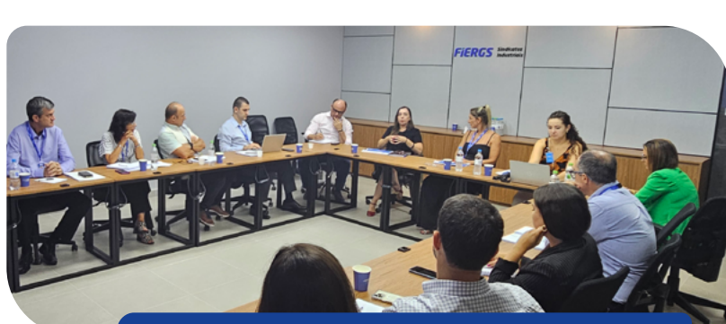
Paranaenses conheceram a gestão dos conselhos temáticos da FIERGS