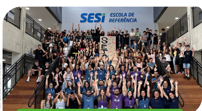
Fevereiro marca o início do primeiro ano letivo da nova Escola Sesi em Canoas