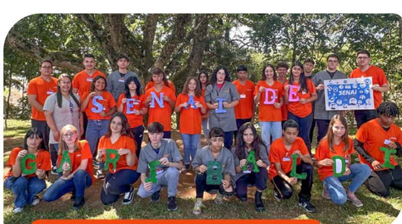
Alunos do Senai foram recebidos em todas as regiões do Estado